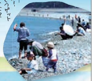
宮崎海岸で ヒスイ原石さがし

日本列島誕生の歴史を知る宝石《ヒスイ(翡翠)》を 富山県朝日町・宮崎海岸へ、さがしに行こう！