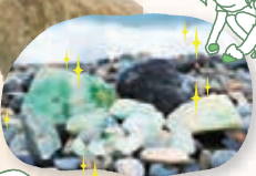
トレジャー ハンティング