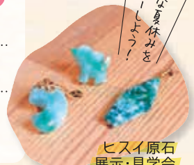
ヒスイ原石 展示・見学会