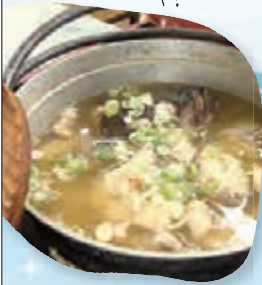
朝日町名物 タラ汁試食