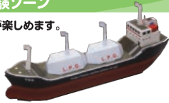
ペーパークラフトの一例▶