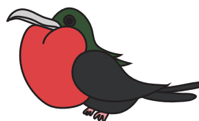
ゲンカンドリ (オス)