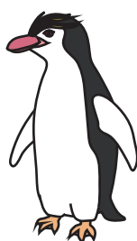
ロイヤルペンギン (メス)