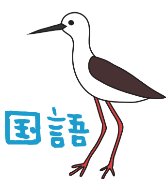
セイタカシギ (メス)

みなさんは、学校で国語や算数、理科、社会科などの学習をしていますが、実はそれらの学習の中には、海と関係していることがたくさんあります。知っていましたか。